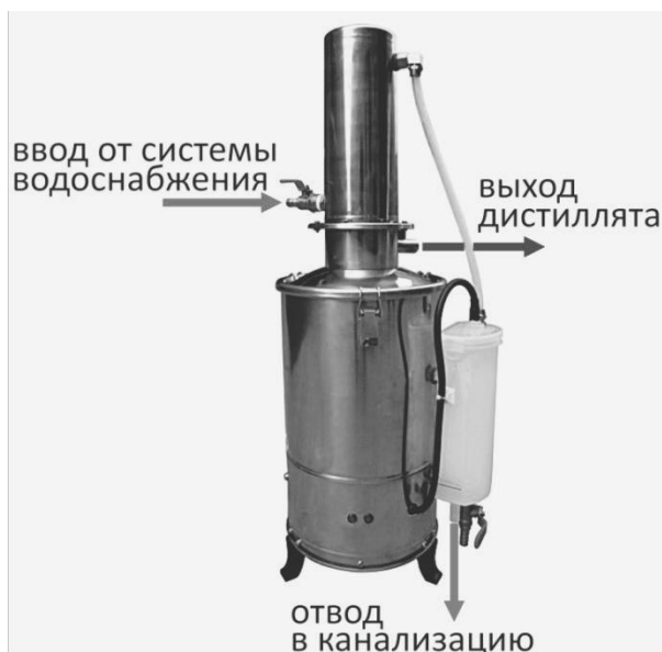
Рисунок 3 – Схема подключения.